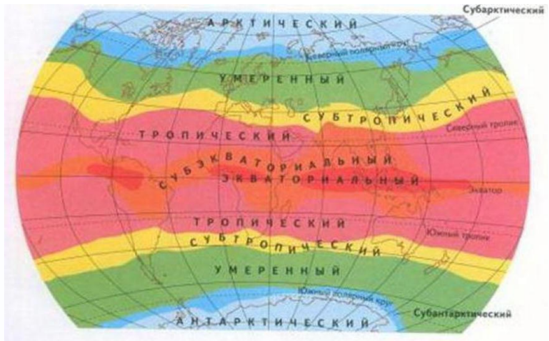
Рис.1 Климатические (географические) пояса Земли

Природные зоны Земли— это большие участки суши с одинаковыми характеристиками: рельефом, почвой, климатом и особым животным и растительным миром.