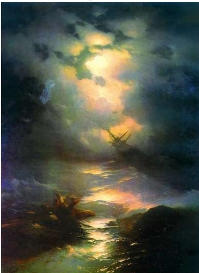
И. Айвазовский «Буря на Северном море»

Соната (где возник жанр, характеристика общая, характеристика каждой части сонаты (очень подробно описать 1 часть), назвать композиторов, которые работали в этом жанре, самые известные сонаты) 2. А) Послушайте 1 часть симфонии №3 «Героической» Л.В. Бетховена. Сравни образы созданные композитором и художником ( не в двух предложениях!!!)